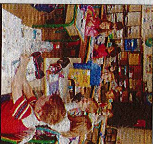
PLAISIR. Chaque début d'après-midi commence par un quart d'heure de lecture silencieuse.